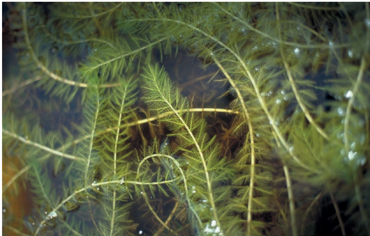
Myriophylle à épis

Pour contrôler la prolifération du myriophylle à épis, plusieurs municipalités et associations de lac ont recours au bâchage. Cette méthode consiste à installer des toiles de jute sur les vastes herbiers où le myriophylle à épis est dense et prédominant. Selon une évaluation produite par le Regroupement des associations pour la protection de l'environnement des lacs et des bassins versants (RAPPEL), il